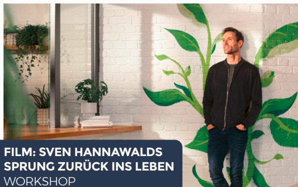
FILM: SVEN HANNAWALDS SPRUNG ZURÜCK INS LEBEN WORKSHOP