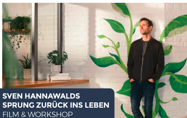
SVEN HANNAWALDS SPRUNG ZURÜCK INS LEBEN FILM & WORKSHOP