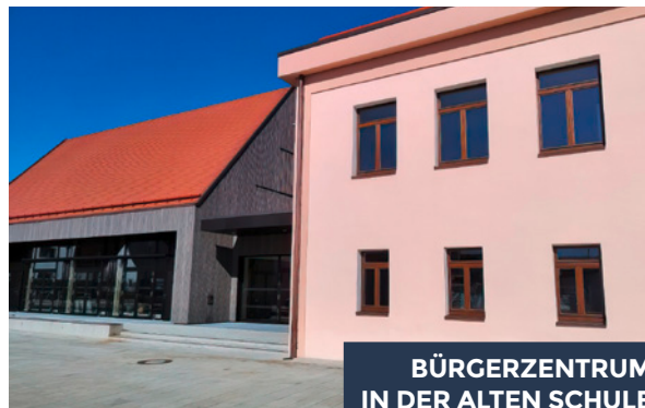
BÜRGERZENTRUM IN DER ALTEN SCHULE